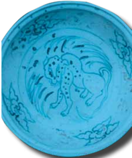
Ảnh 3: Hình hổ trang trí trên đĩa gốm Chu Đậu vót được từ tàu đắm Cù Lao Chàm. Hiện vật của Bảo tàng Quảng Nam.