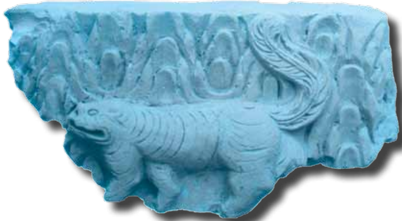
Ảnh 1: Mảnh gạch xây tháp thời Trần, khai quật ở Hoàng Thành Thăng Long. Đất nung màu đỏ, trang trí nổi hình hổ và văn sóng nước. Hiện vật của Bảo tàng Lịch sử Việt Nam. Ảnh trích từ sách “Cổ vật Việt Nam”.

Hổ (虎), người Việt còn gọi bằng nhiều tên khác như: cạp, hùm, khải, ông ba mươi, là động vật có vú thuộc họ Mèo (Felidae), là một trong bốn loại “mèo lớn” thuộc chi Panthera và là loài thú ăn thịt sống, kể cả người. (1) Vì thế, hổ được con người kính nể, e sợ. Hổ là con vật đứng thứ 3 trong “thập nhị địa chi” trong lịch pháp của một số nước phương Đông.