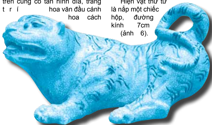
Ảnh 8: Tượng hổ nằm bằng gốm, men rạn trắng ngà. Hiệu đề Cảnh Hưng. Hiện vật của Bảo tàng Lịch sử Việt Nam.

Hiện vật thứ tư là nắp một chiếc hộp, đường kính 7cm (ảnh 6).