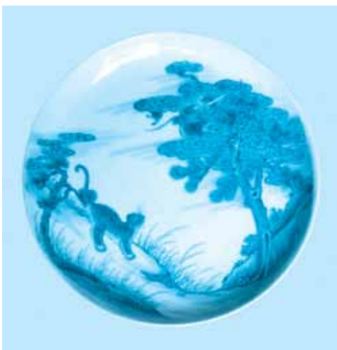
Ảnh 9: Đĩa trà ký kiểu đời Tự Đức vẽ đề tài “long hổ trang hùng”. Hiện vật thuộc sở hữu của ông Đoàn Phước Thuận (Tuy Hòa, Phú Yên).

Tại Bảo tàng Lịch sử Việt Nam ở Hà Nội có hai món đồ gốm khá đặc biệt. Đó là tượng của hai con hổ làm bằng men rạn màu ngà, vằn lưng hổ bằng men nâu sẫm (ảnh 7 và ảnh 8). Theo miêu tả trong sách Cổ vật Việt Nam do Bộ Văn hóa Thông tin xuất bản năm 2003, thì một trong hai tượng hổ này có lạc khoản ghi niên hiệu