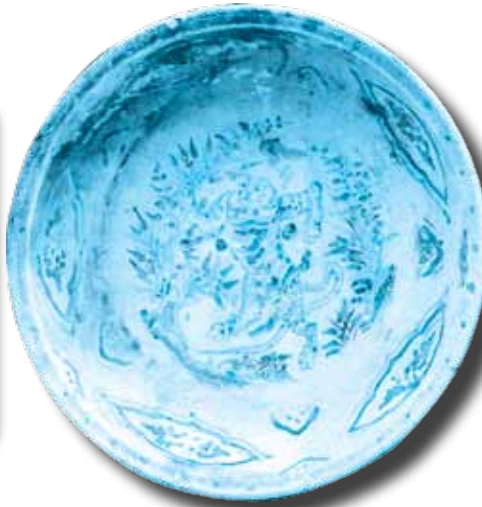
Ảnh 4: Hình hổ trang trí trên đĩa gốm Chu Đậu vót được từ tàu đắm Cù Lao Chàm. Hiện vật của Bảo tàng Quảng Nam.