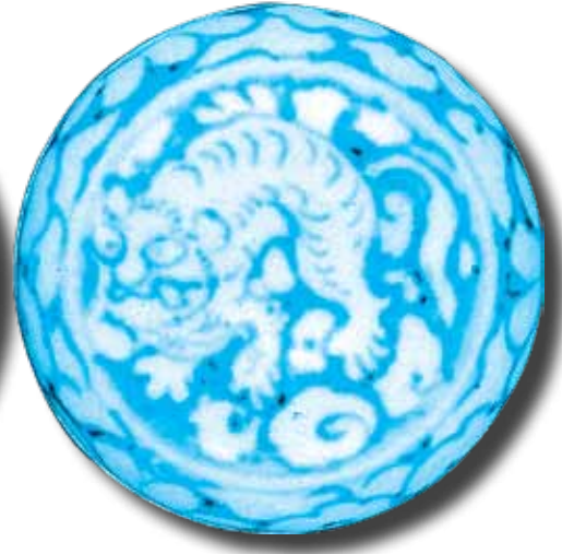
Ảnh 6: Hình hổ trang trí trên nắp hộp gốm Chu Đậu vót được từ tàu đắm Cù Lao Chàm. Hiện vật của Bảo tàng Quảng Nam.

Bảo tàng Quảng Nam hiện đang lưu giữ bốn hiện vật gốm Chu Đậu, xuất xứ từ tàu đắm Cù Lao Chàm có trang trí hình tượng hổ. Hiện vật thứ nhất là chiếc đĩa vẽ men tam thái (ảnh 3). Hình trang trí trong lòng đĩa thể hiện một con hổ ngồi bằng men xanh chàm (gốc oxyd cobalt), có điểm xuyết một số họa tiết ở phần cuối thân hổ bằng men màu đỏ (gốc oxyd sắt). Xung quanh hình hổ là các nét vẽ thể hiện các đám cỏ lau. Bên ngoài phần trang trí chủ đạo này là dải hoa văn thể hiện bốn cụm mây cách điệu đối xứng nhau bằng màu chàm, xen kẽ với các họa tiết vân khiên bằng men đỏ.