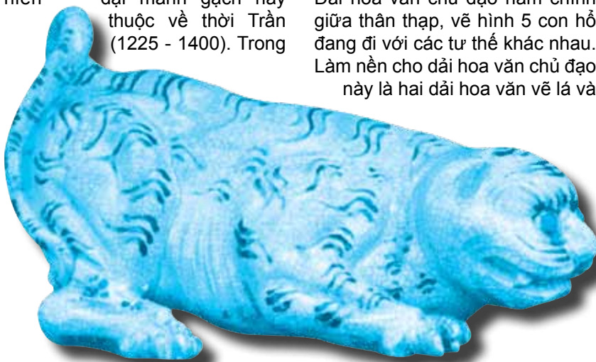
Ảnh 7: Tượng hổ nằm bằng gốm, men rạn trắng ngà. Hiện vật của Bảo tàng Lịch sử Việt Nam.

Trong các di vật từ Hoàng Thành Thăng Long, có một mảnh gạch xây tháp bằng đất nung màu đỏ, dài 32cm, rộng 15cm. Mảnh gạch này khai quật ở Kim Mã (Hà Nội), trên đó trang trí hình một con hổ nổi trên nền văn sóng nước (ảnh 1). Điều thú vị là tuy toàn thân con hổ được miêu tả gần với hình ảnh con hổ thật, nhưng phần đuôi của nó lại giống đuôi của con sóc. Tạo hình đuôi hổ này có cùng một kiểu uốn lượn và một kiểu hoa văn như đuôi của những chim phụng trong có đồ án trang trí hình lá đề gắn trên các viên ngói bờ thời Trần. Đây cũng là một trong những lý do để các nhà nghiên cứu xác định niên đại mảnh gạch này thuộc về thời Trần (1225 - 1400). Trong