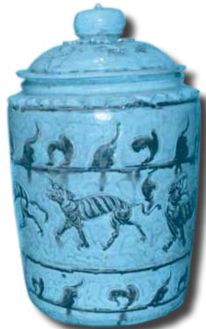
Ảnh 2: Tháp gốm hoa nâu thời Trần. Trang trí hình 5 con hổ vòng quanh thân. Hiện vật của Bảo tàng Guimet.

Một cổ vật gốm khác, cũng thuộc thời Trần, được coi là cổ vật toàn bích nhất trong các món đồ gốm Việt Nam có hình tượng hổ. Đó là chiếc tháp gốm hoa nâu vẽ 5 con hổ (ảnh 2) hiện đang trưng bày tại Bảo tàng Quốc gia về Nghệ thuật Châu Á Guimet (Bảo tàng Guimet) ở Paris (Pháp). TS. Piere Baptiste, quản thủ sưu tập Đông Nam Á của Bảo tàng Guimet cho hay: đây là món đồ gốm có đề tài trang trí độc đáo nhất, và đặc biệt là lành lặn nhất, trong số các cổ vật gốm thời Trần mà bảo tàng này đang sở hữu. Chiếc tháp gốm men rạn màu ngà, cao khoảng 45cm (không kể nắp), thành ngoài có ba dải hoa văn vẽ bằng thứ men nâu điển hình của gốm hoa nâu thời Trần. Dải hoa văn chủ đạo nằm chính giữa thân tháp, vẽ hình 5 con hổ đang đi với các tư thế khác nhau. Làm nền cho dải hoa văn chủ đạo này là hai dải hoa văn vẽ lá và